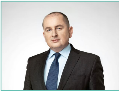
E.S. Marek Szczygiel Ambasador al Republicii Polone în România

E.S. Domnul Ambasador Marek Szczygiel s-a născut în 1969 în Polonia. Absolvent de Drept și Relații Internaționale, și-a început cariera în Serviciul Extern ca oficial pentru România și Bulgaria în Departamentul de Afaceri Europene al Ministerului Polonez al Afacerilor Externe. Diplomat de carieră, acesta a lucrat în perioada 1995 - 2000 la Ambasada Poloniei la Stockholm. S-a specializat apoi în politici de securitate și a deținut de două ori postul de Director Adjunct al Departamentului de Politici de Securitate în Ministerul Afacerilor Externe, fiind responsabil de securitatea regională (2002 - 2004) și de probleme de neproliferare, dezarmare și control al exportului (1998 - 2001), precum și poziția de Șef Adjunct al Misiunii Poloneze la OSCE și la Biroul ONU din Viena (2004 - 2008).