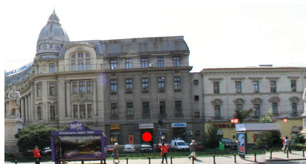
Punctul roșu marchează intrarea noastră din clădirea atașată BCR

Click aici pentru mai multe detalii http://www.ier.ro/index.php/site/curs_page/61