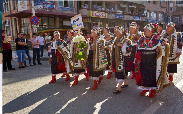
“Îmbunătățirea și conservarea patrimoniului cultural bucovinean”