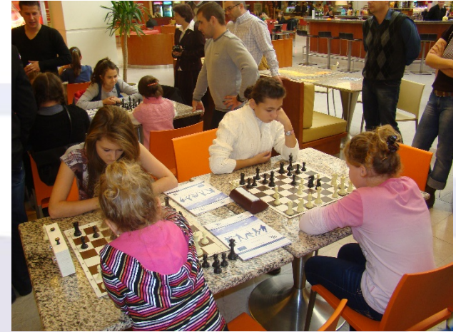
“Prin sport se unesc destine- rețea transfrontalieră a tinerilor sportivi-TYN”