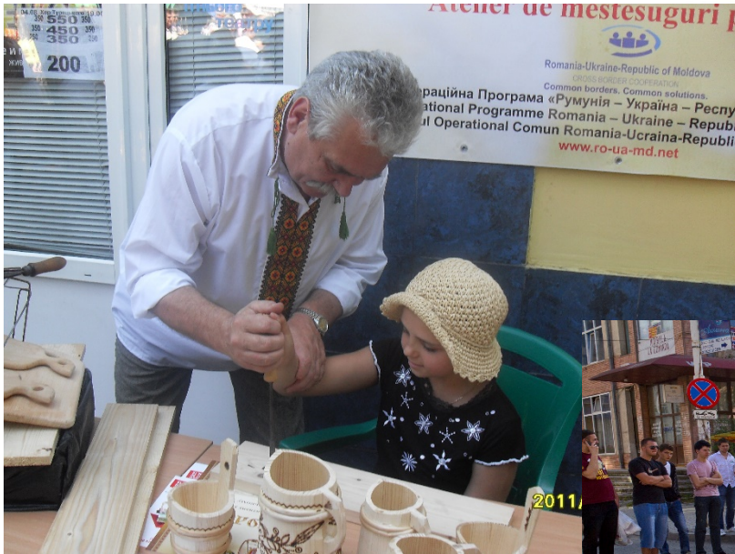
“Dezvoltarea unei rețele de turism festiv în Bucovina”